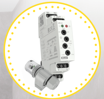
LIC-2 + fotosensor SKS