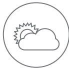
Luz del día